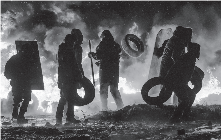
Image 3. Combats sur le Maïdan les 22 et 23 janvier 2014.