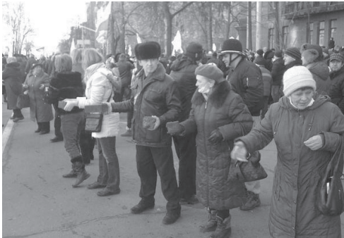
Image 7. La chaîne humaine et les pavés.

De plus, il apparaît qu'au pavé s'attachent des significations singulières que les autres objets du Maïdan, que nous avons analysés, ne possèdent pas totalement. En effet, la veille des assauts des berkouts , on a vu des hommes et des femmes, des personnes âgées et des jeunes gens, des Ukrainiens de l'Est et de l'Ouest, des citadins et des villageois, créer une véritable chaîne humaine pour transmettre de main en main des pavés vers les barricades – les combattants aux avant-postes utilisant ces pavés comme des projectiles destinés à repousser les forces de police et à interdire, par conséquent, toute intrusion de celles-ci sur le Maïdan.