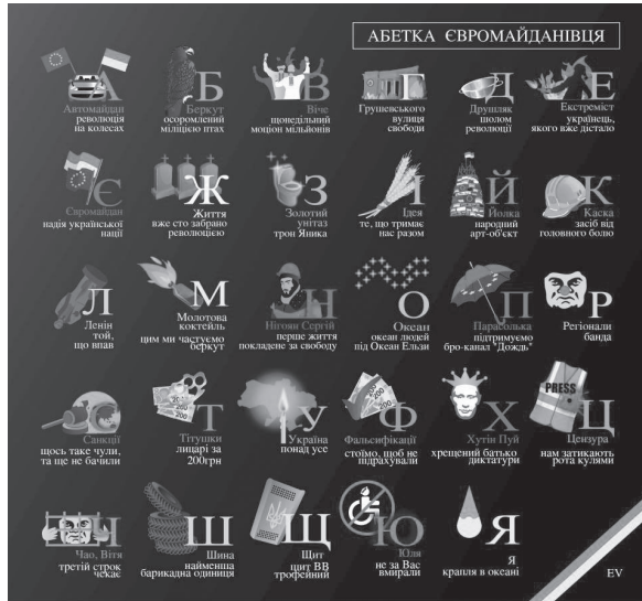
Image 4. L'« Abécédaire du Maidan ». Auteur de l'affiche Yevheniya Melekhovets'.

d'une barricade » ; « L'arbre de Noël – l'art-objet populaire » ; « La passoire – le casque de la révolution », etc.).