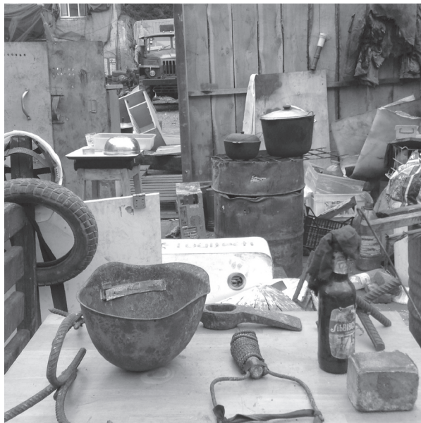
Image 9. Les objets dans un musée improvisé sur le Maïdan. Photo de Galyna Dranenko (mai 2014).