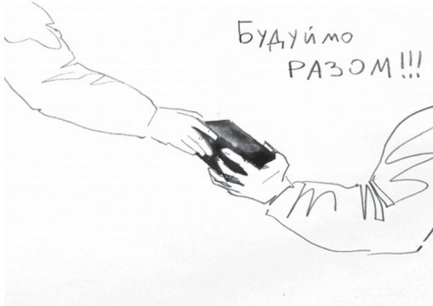
Image 11. Un projet artistique, « Les Cartes postales du Maïdan », inscription « Construisons ensemble ».

Un autre projet international, ukraino-polonais, intitulé « Les Cartes postales du Maïdan 29 », a eu lieu à Varsovie. Ce projet s'appuie sur l'expérience vive que les artistes ont eue des événements qui se déroulaient sur le Maïdan. En effet, ils ont entrepris de visiter dans les hôpitaux les blessés et les ont sollicités pour qu'ils veuillent bien leur raconter le parcours qui les avait conduits à participer au soulèvement ; pendant l'écoute de leurs récits, les artistes dessinaient, créaient des objets divers et procédaient à des enregistrements audio-visuels, etc. Le premier objectif d'une telle démarche consistait, bien entendu, à soutenir moralement ces victimes, à exprimer la solidarité qui les entourait et à témoigner, vis-à-vis de l'extérieur, de la multiplicité et de la variété de leurs identités nationales et de leurs conditions sociales. Mais, au cours de l'expérience elle-même, le projet a quelque peu évolué et s'est imposé l'idée de créer des cartes postales dont les auteurs seraient aussi bien les visiteurs, les artistes, que les visités, les blessés cloués sur leur lit d'hôpital 30 . Ces cartes privilégient, le plus souvent, la représentation des objets du Maïdan, et, parmi ceux-ci, le pavé, transformé en projectile lorsqu'il est brandi au bout d'un bras, occupe une place de choix.