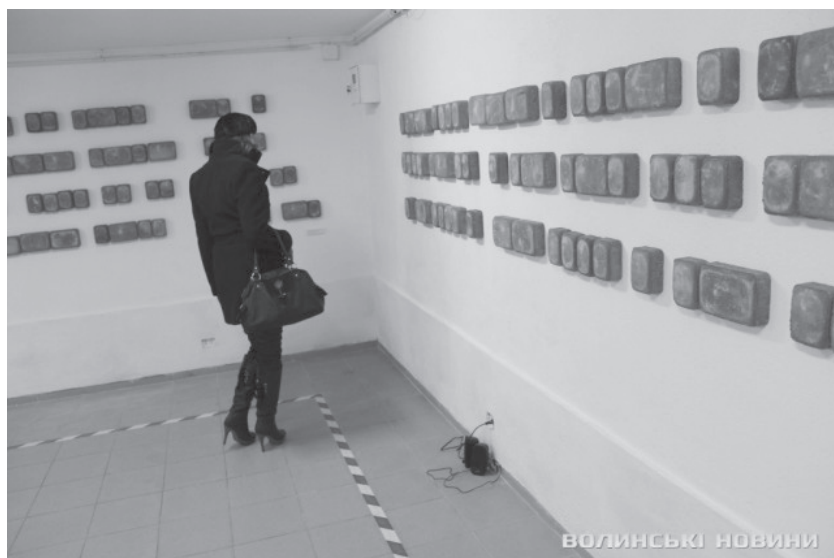
Image 10. Une installation artistique d'Istvan Kus et Karina Aroutunian (Loutsk, 2014), « Silence, s'il vous plaît ».