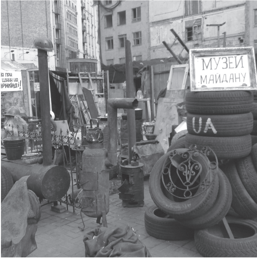
Image 8 : Inscription « Musée du Maidan ». Photo de Galyna Dranenko (mai 2014).

improvisés apparaissent çà et là sur la place et exposent une quantité d'objets employés lors des affrontements – le pavé, cela va sans dire, comme le montre la photo que nous avons prise au mois de mai 2014, y occupe une place de choix.