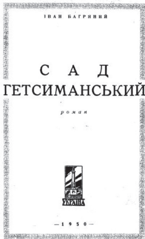
Illustration 1 : Couverture de la première édition du roman d'Ivan Bagrianyi Le Jardin de Gethsémani (Neu-Ulm, 1950).

Pour mettre en évidence les causes et les origines d'une telle désaffection, il nous semble nécessaire de s'interroger sur le contexte historique dans lequel ce roman a été traduit et publié en France. Si dans la tradition humaniste, on attribue au mot traducere la signification bien connue de « faire passer d'une langue dans une autre », on sait aussi que ce mot latin voulait dire « conduire au-delà, faire passer, traverser ; faire passer d'un point à un autre ». La première partie de notre étude tentera donc de mettre à jour les stratégies – et leurs effets – entreprises par les agents du champ littéraire, à savoir : l'auteur, le traducteur et l'éditeur. En effet, ce sont ces acteurs du champ qui ont dû conduire l'œuvre bagrianienne au-delà du cercle restreint de l'immigration ukrainienne.